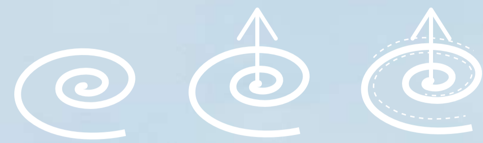
FENOMENOLOGIA DE UM VÓRTICE A CONDUÇÃO A UM PONTO ABSOLUTO

MATERIALMENTE, "MERBO'S" BUSCA LEVEZA, LUMINOSIDADE, PERMEABILIDADE E INTELIGÊNCIA ENERGÉTICA. SUA ESTRUTURA EM MADEIRA DE REFLORESTAMENTO GARANTE AGILIDADE E LIMPEZA CONSTRUTIVA, ASSIM COMO REDUÇÃO DO PESO TOTAL, JÁ O FECHAMENTO EM POLICARBONATO RECICLADO LEITOSO, TRANSLUCIDEZ DURANTE O DIA E EMISSIVIDADE NO PERÍODO DA NOITE, INCORPORANDO O CARÁTER DE "OBJETO LÁTERNA". SUA BASE/FUNDAÇÃO, ASSIM COMO A CÁPSULA DO TEMPO, SÃO EM CONCRETO, GARANTINDO A DURABILIDADE DA BASE EM CONTATO COM O SOLO E SUA RÍDIDez. JÁ O MATERIAL ESCOLHIDO PARA A PROMENADE E DEMAIS SUPERFÍCIES, O PISO ECOLÓGICO DRENANTE BRANCO MOLDADO IN LOCO GARANTE A PERMEABILIDADE DO SOLO, O CARÁTER MONOLÍTICO PROPOSTO, ASSIM COMO UMA MAIOR RUGOSIDADE DO PISO, CONFERINDO MAIS ESTABILIDADE E SEGURANÇA NO CAMINHAR. COM RELAÇÃO A ESPÉCIES VEGETAIS, OPTOU-SE POR UM VASTO GRAMADO QUE, ALIADO AO TALUDE, PROPÕEM UMA SUPERFÍCIE CONTÍNUA, SÓLIDA, CAMINHÁVEL E SIMPLES, ONDE O MISTÉRIO E PECULIARIDADE DO MENIR SUBSISTE EM FACE DA EXUBERÂNCIA E IMPÉRIO DA MATA ATLÂNTICA CIRCUNDANTE.