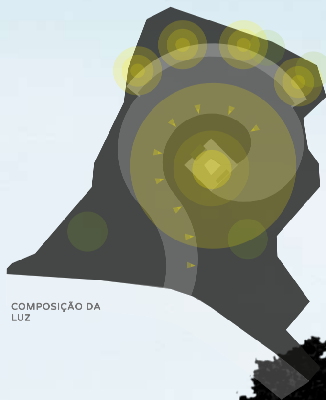
COMPOSIÇÃO DA LUZ