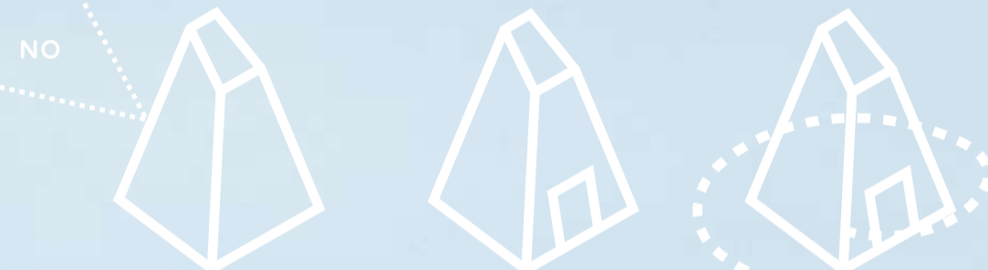
SÓLIDO PENETRÁVEL CAMINHÁVEL