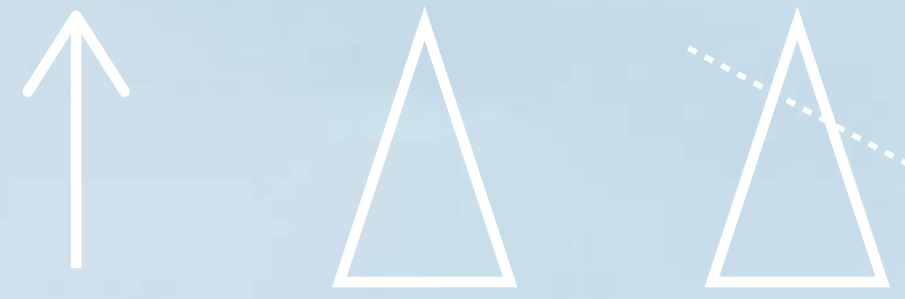
VERTICALIDADE PIRAMIDAL AFIRMAÇÃO DE UMA COORDENADA E DE UM MISTÉRIO