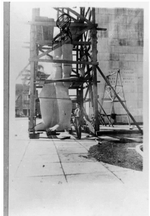
“O Homem Nu” sendo instalado na Praça 19 de Dezembro.