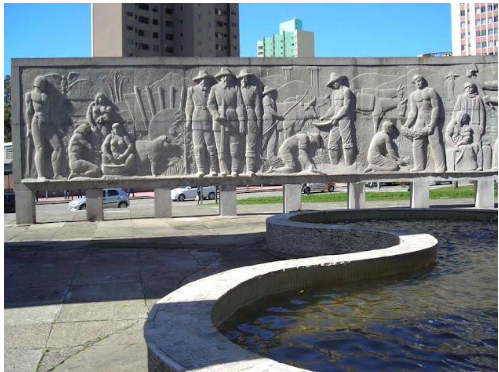
O Painel Histórico, instalado na Praça 19 de Dezembro.