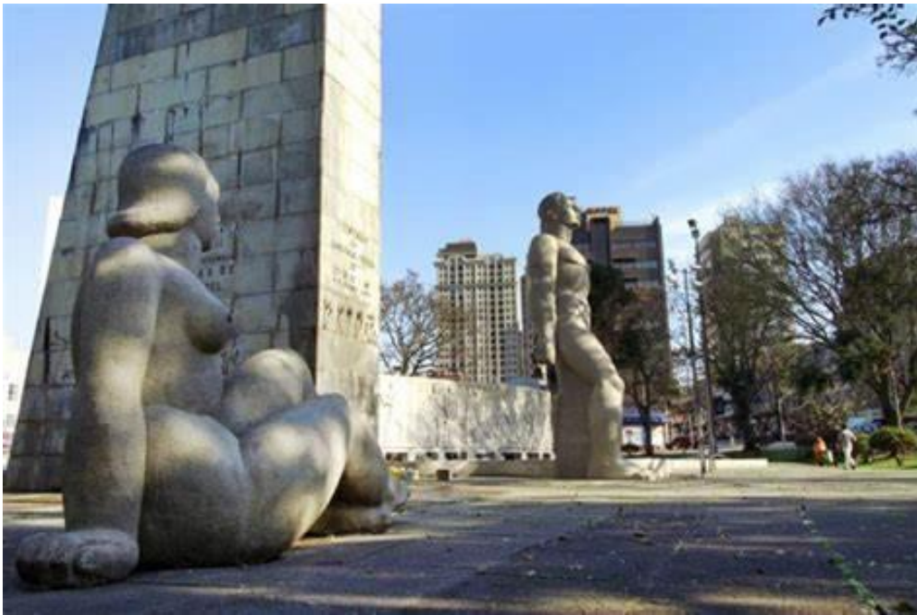
A Mulher e o Homem Nus na Praça 19 de Dezembro.